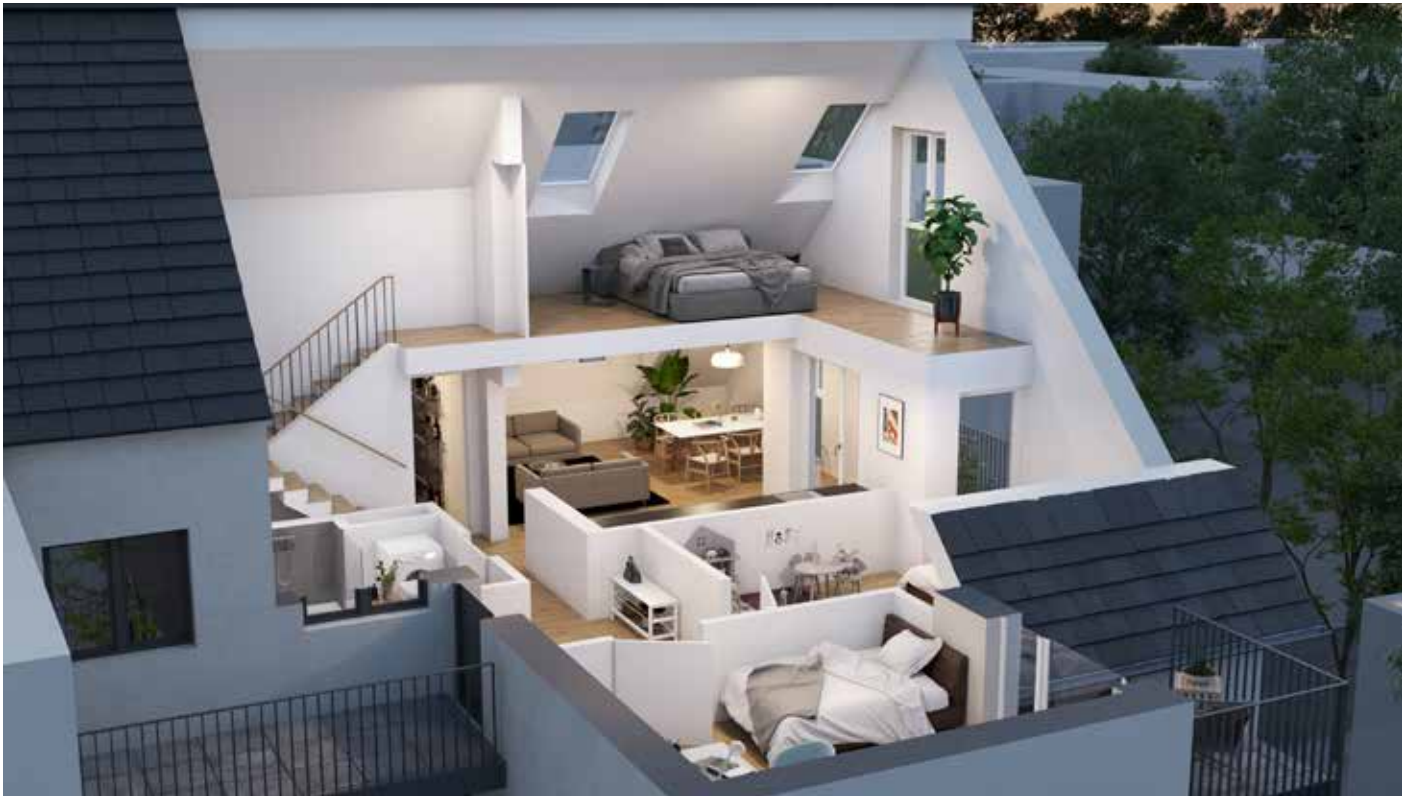
Beispielhafte Innenansicht einer Dachgeschosswohnung