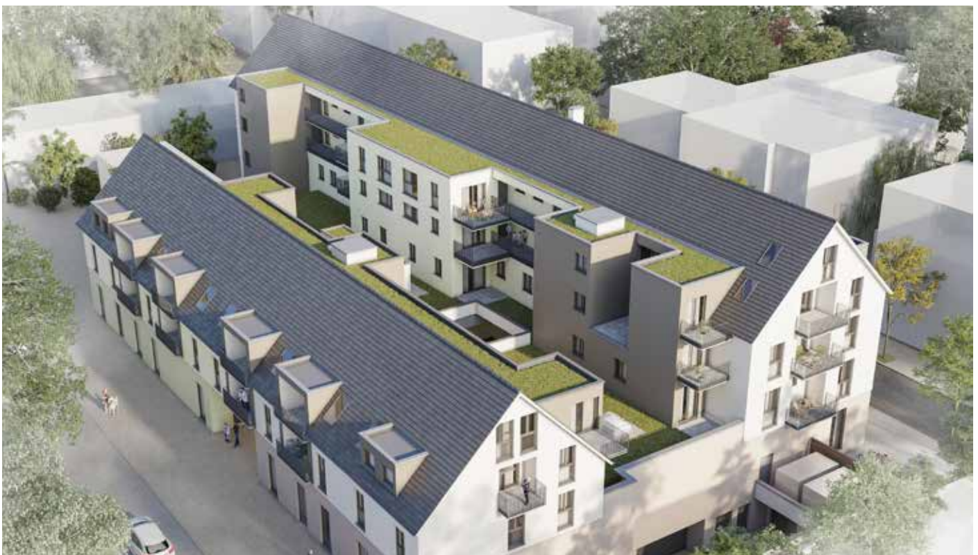
Außenansicht von oben