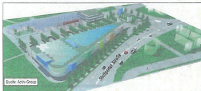
Das neue Entree am Waiblinger Stadtrand.

„Abgespeckte“ Konzeption stößt auf Zustimmung